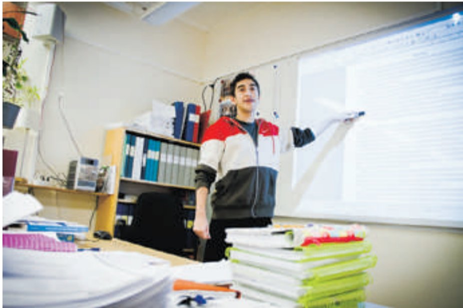
MODERN. Med en modern utrustning kan lektionerna utformas på ett mer varierat sätt och eleverna kan själva använda tekniken i sina presentationer.

Bra IT-stöd i skolan kan ge ett lyft för elever och lärare. Mimerskolan i Sundsvall har satsat på interaktiva projektorer i klassrummen för bättre presentationer.