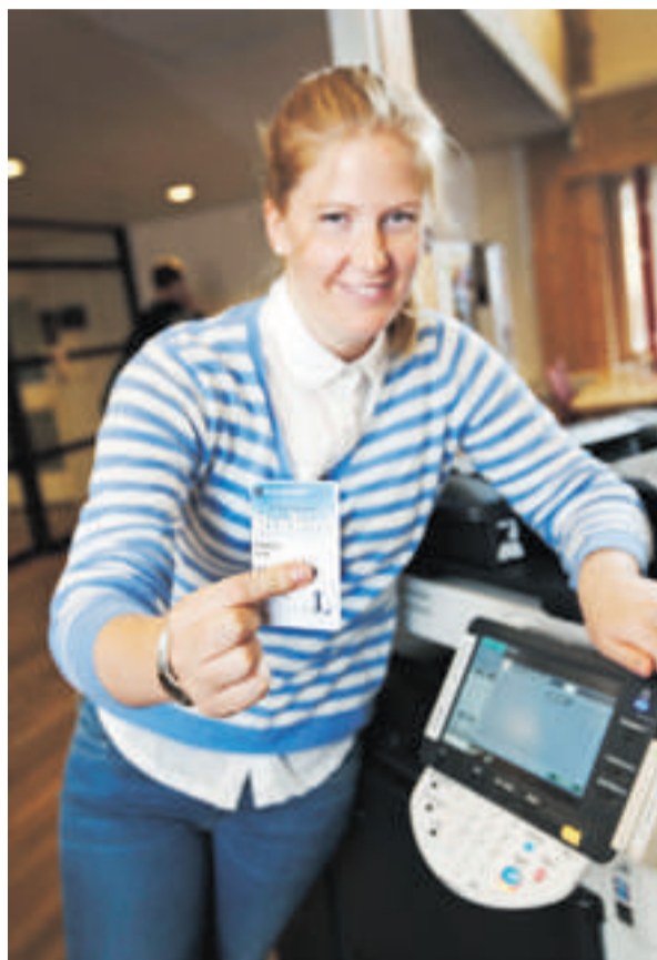
ENKELT. Luleå tekniska universitet använder en ny utskriftstjänst som gör det betydligt enklare att få en översikt över användningen.

Några stora fördelar med den nya utskriftstjänsten är att skrivarna har en så kallad "follow-me print" kö, samt att användarna har fått en bra översikt av deras utskriftshistorik via ett webbgränssnitt. Användarna har också överblick över tillgängliga skrivare och väljer den som för tillfället passar bäst. Inga utskrifter levereras förrän den som har skrivit ut går till vald skrivare på något av LTU:s campus och identifierar sig med ett kort.